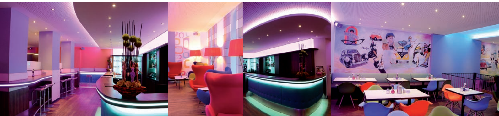
CITYHOTEL THÜRINGER HOF

Licht: Dank eines ausgeklügelten Lichtkonzepts, das auch den Tresen mit einbezieht, werden zusammen mit dem roten Rückbuffet farbliche Akzente gesetzt, die ein Sich-Verlieren in zu viel Luftigkeit verhindern.