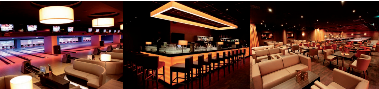
BOWLING WORLD HANNOVER

Der Dornröschenschlaf ist beendet – nachdem die Osterstraße lange Zeit eher ein Schattendasein im gesamten City-Ensemble geführt hat, erwacht sie nun zu neuem Leben; auffällig zu sehen besonders im Abschnitt zwischen Aegidienkirche und Platz der Weltausstellung. Unübersehbare Hinweise auf den Wandel sind hier der Neubau der Deutschen Hypo, die neue farbenfrohe Außenfassade des Thüringer Hofes und auch die neue Leuchtreklame am Parkhaus der union-boden gmbh. Diese Reklame der Bowling World Hannover gibt auch einen Hinweis auf die Veränderungen, die sich hinter den Fassaden tun. Hier stehen drei Unternehmen mit aufregenden Design-Konzepten hervor: die Bowling World Hannover, das Cityhotel Thüringer Hof und das Restaurant joka.