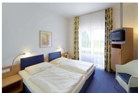
Blick in ein Zimmer des ****Designhotels...