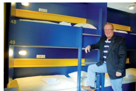
...und hier die Betten des Bed'nBudget Hostel